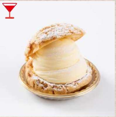
シュー・ア・ラ・クレーム