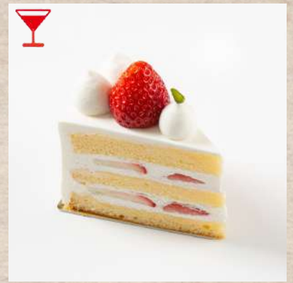
ストロベリーショートケーキ