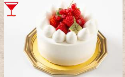
ストロベリーショートケーキ