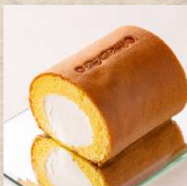
高岡ロール ～プレミアムホワイト～ ハーフ